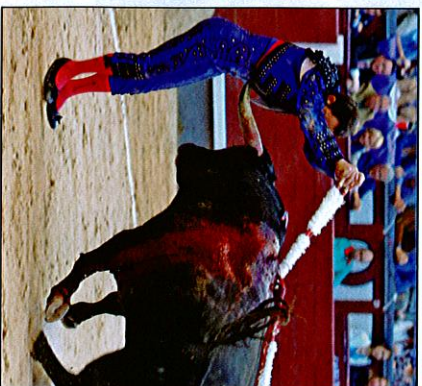
Casanova se la jugó de verdad en este par.