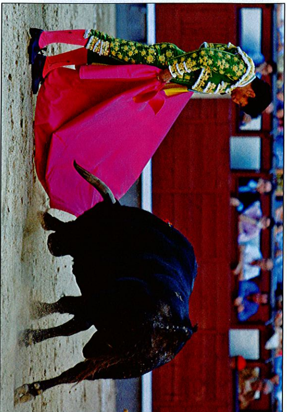
El Fundi no tuvo opción alguna de lucimiento en el cierre de feria ante un lote imposible.